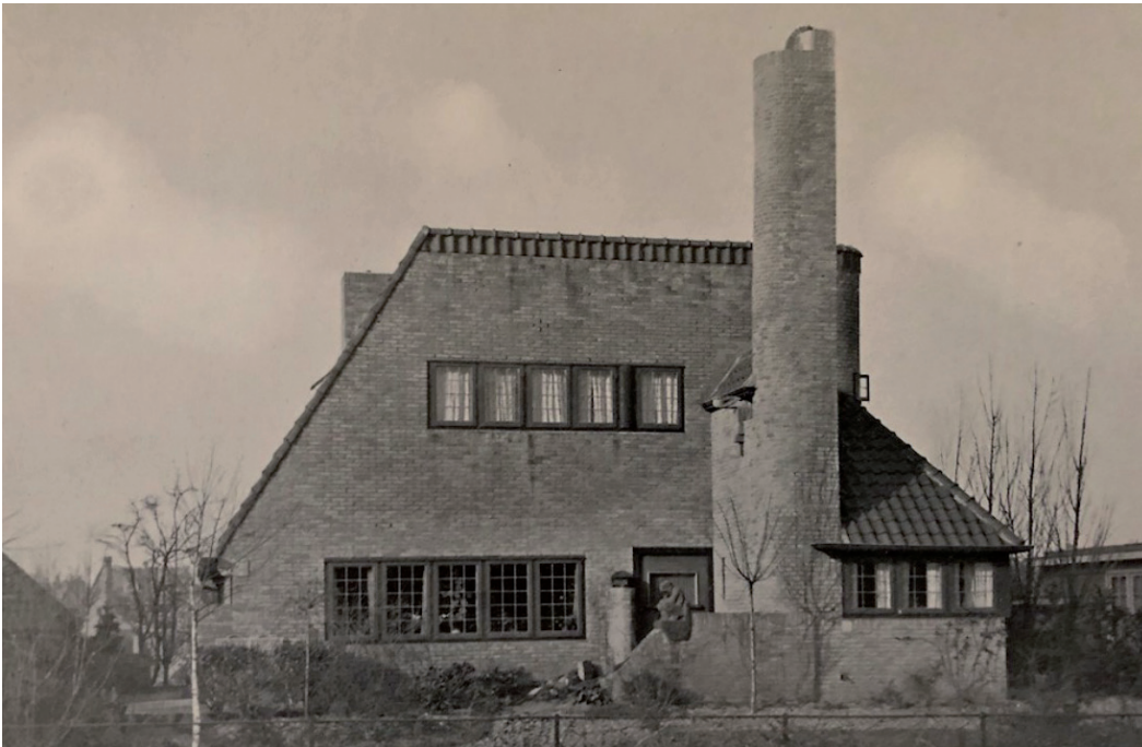
Een bescheiden villaatje, kort na de oplevering in 1926

atelier uitbouwde. Achter het huis kwam een tweede atelier – voor Nico, het eerste atelier ging naar zijn vrouw. Het nieuwe atelier stak ver de tuin in. Je zou daar een groot raam op het noorden verwachten, maar het eindigt in een blinde muur. Blijkbaar was ruimte voor de beeldhouwer belangrijker dan (noorder)