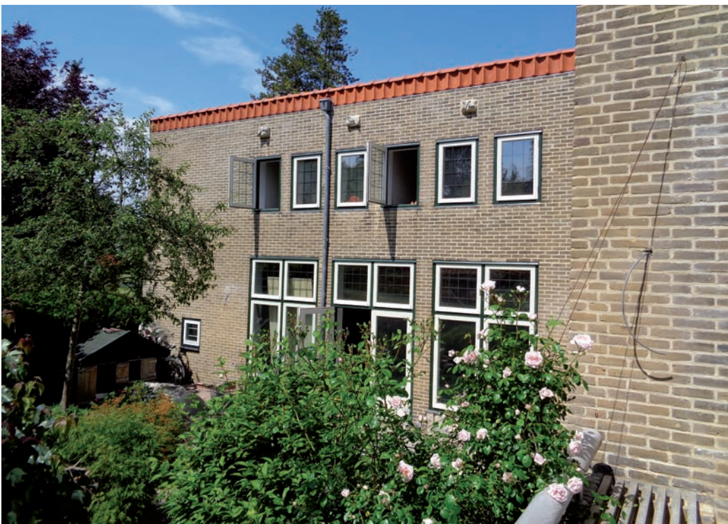
Het uitgebreide atelier in 1956

In 1958 werd de garage nog wat uitgebreid en toen was er van het oorspronkelijke