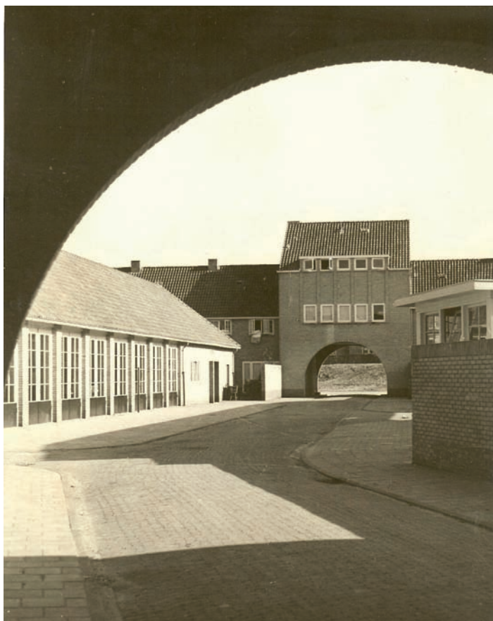
Sociale woningbouw aan 1ste Industriestraat

villaatje niet veel meer over, behalve de voorgevel met de typerende hoog oprijzende halfronde schoorsteen en het afgeknotte dak, dat is afgezoomd met een rij verticaal