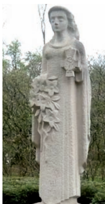
Het Monument voor de Gevallen en de Frederik van Eedenweg