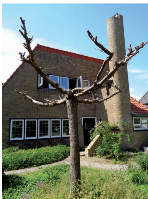
De voorgevel, nog in oorspronkelijke staat

villaatje niet veel meer over, behalve de voorgevel met de typerende hoog oprijzende halfronde schoorsteen en het afgeknotte dak, dat is afgezoomd met een rij verticaal