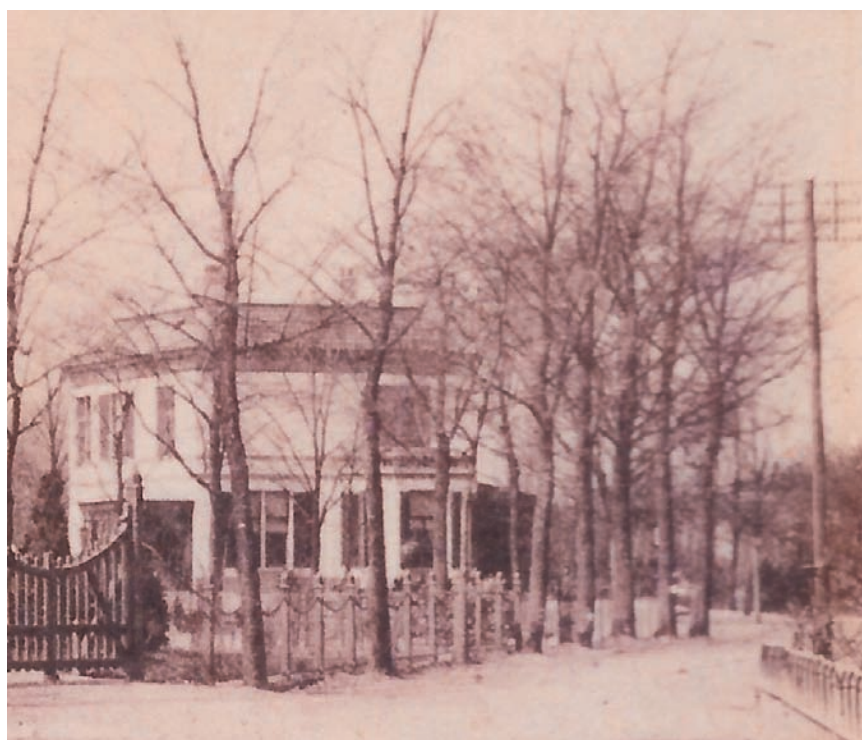
Meerweg 23 omstreeks 1900 (fragment ansichtkaart R. Los Bussum)

Het gemeentelijk monument Meerweg 23 was een van de eerste huizen op de Meerweg, en heeft een bewogen geschiedenis: behalve woonhuis, pension en bejaardenhuis was het bijna ook een ‘sauna met nachtvergunning’. Hieronder volgt de geschiedenis van het huis en zijn bewoners.