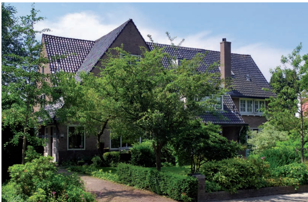
Meerweg 25 t/m 29

ter vergroting van de zit- en eetkamer. Bij het huis hoorde een terrein dat bijna tot de Graaf Florislaan doorliep. Omstreeks 1923 verkocht de weduwe daarvan een aan de Meerweg grenzend gedeelte, waarop de drie-onder-een-kap-woningen gebouwd werden die nu de nummers 25, 27 en 29