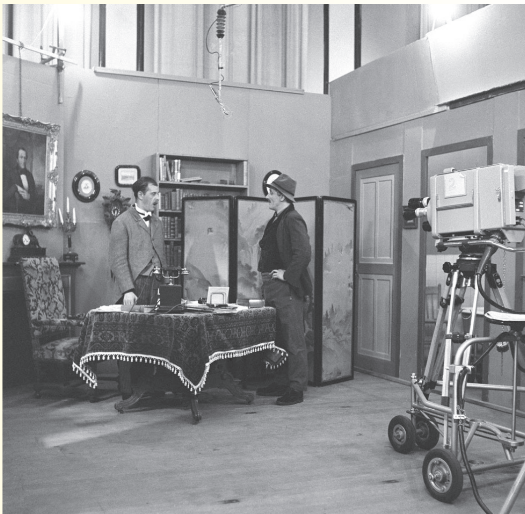
Joop Doderer als Swiebertje (links) en Guus Hermus als de burgemeester in de eerste uitzending van Swiebertje vanuit Studio Eltheto, 20 april 1955