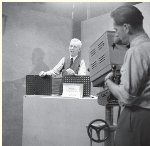
Zo informeel ging het eraan toe tijdens de opnamen. Dit was op 5 oktober 1951 tijdens de eerste uitzending van de AVRO