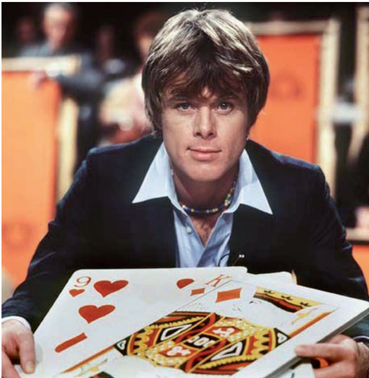
Willem Ruijs Show

doordat hij heel intens mee-leeft met zijn kandidaten. Ruis stal altijd graag de show door te zingen of een sketch te spelen met grote internationale artiesten, onder wie bijvoorbeeld Tina Turner. De show startte in 1981 en in 1982 was het een van de best bekeken programma's. In 1984 stopte Ruis ermee: hij ging de Sterrenshow presenteren.