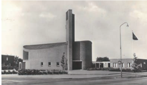
De Verlosserkerk aan de Ceintuurbaan

die voor ons zaten. Als die dan tijdens een gebed opstonden viel het geld rinkelend op de grond met alle gedoe eromheen. Verder