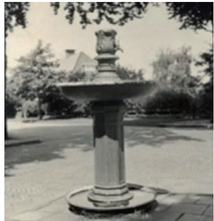
Kiosk bij de Gooische Boer met rechts de drinkbak

toen werd bestuurd door Willem Sandberg. Die zag veel in Wim, kocht ook persoonlijk werk van hem en gaf hem een eerste tentoonstelling in museum Fodor. Wim ging na een periode van conflicten en ruzie met mijn ouders in Amsterdam wonen en betrok daar ook zijn eerste atelier. De grote tekentafel die hij al in Bussum gebruikte, verhuisde mee.