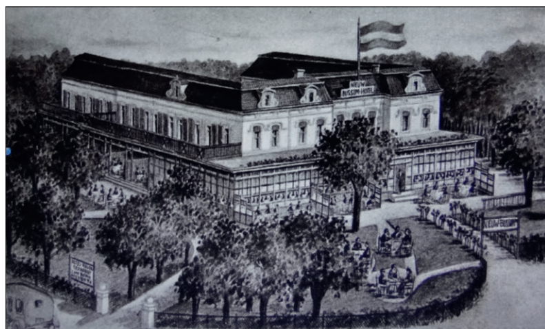
Hotel Nieuw Bussum.