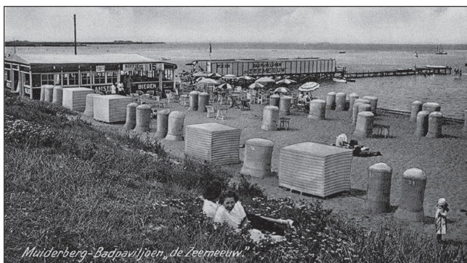
Muiderberg Badpaviljoen "de Zeemeeuw"