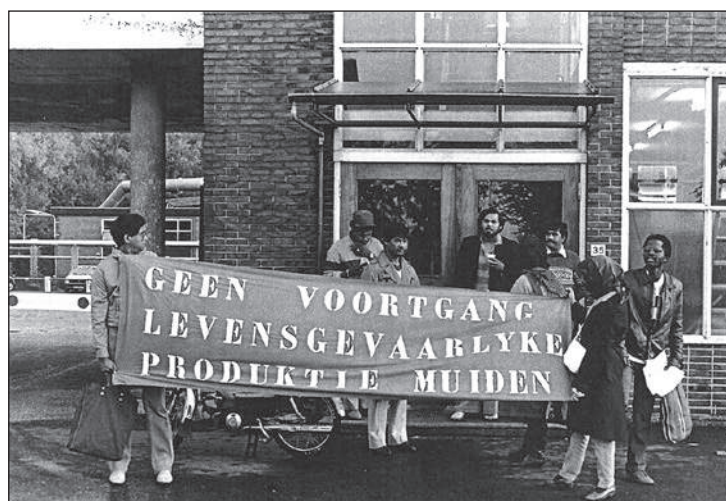
Demonstratie tegen de voortzetting van de kruitproductie in september 1983, toen er binnen enkele maanden 4 doden te betreuren waren onder het personeel van de fabriek

af, met als gevolg een hoogconjunctuur voor de kruitproductie. Als Nederland op 10 mei betrokken raakt bij de Tweede Wereldoorlog en vervolgens bezet wordt, wordt de productie stilgelegd. De bedreiging vanuit de lucht is te gevaarlijk en men kan geen kant op door het inunderen van de polders om Muiden. Onmiddellijk na de oorlog wordt de productie weer