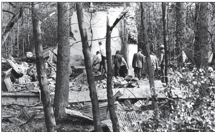
De puinhopen na weer een ontploffing

van stoom als beweegkracht verandert het hele bedrijf. De nieuwe inrichting komt zowel de kwaliteit van het product als de winstgevendheid van het bedrijf ten goede.