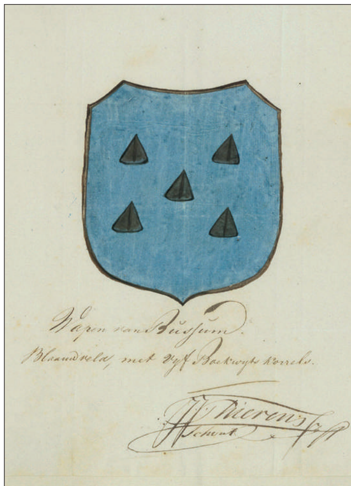
Het Bussums wapen zoals aangevraagd op 20 september 1817 door schout J.J. Thierens Jzn (archief van de Hoge Raad van Adel in Den Haag)

besluit pas in handen, gevoegd bij een brief van de Commissaris der Koningin in Noord Holland (J.W.M. Schorer), die terloops vroeg om de leges van fl. 6,97 ook nog even over te maken.