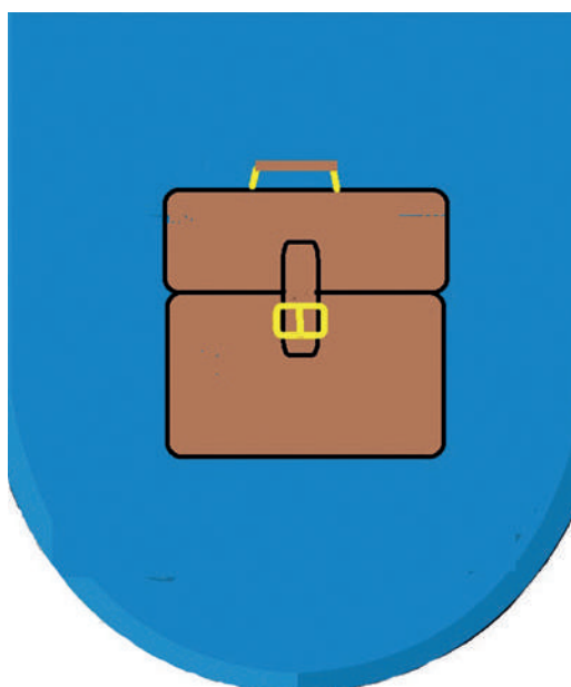
Het Bussumse gemeentewapen, zoals officieel geregistreerd bij de Hoge Raad voor de Adel in 1896