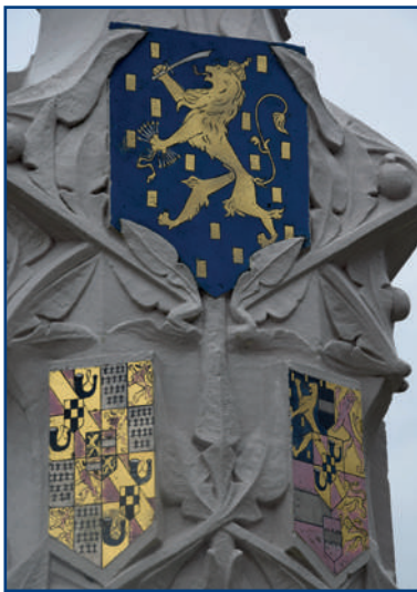
Rijkswapen, wapen van René van Châlon en wapen van Willem van Oranje

René van Châlon (Breda, 5 februari 1519 – Saint-Dizier, 18 juli 1544), ook wel Reynaert van Nassau genoemd, was stadhouder van Holland, Zeeland en Utrecht en vanaf 1543 ook van Gelre en Zutphen. Vanaf 1530 was hij prins van Oranje. Hij werd maar 25 jaar oud. In 1530 erfde hij, 11 jaar oud, van zijn kinderloos gestorven oom Filibert van Châlon (1502-1530) het soevereine en in naam onafhankelijke vorstendom Orange (Oranje). René is de eerste Nassau die zich prins van Oranje mocht noemen. Hij nam het devies van de familie 'Je maintiendrai Châlon' over, dat hij later wijzigde in 'Je maintiendrai Nassau' . De Nederlandse wapenspreuk 'Je maintiendrai' is hiervan afkomstig.