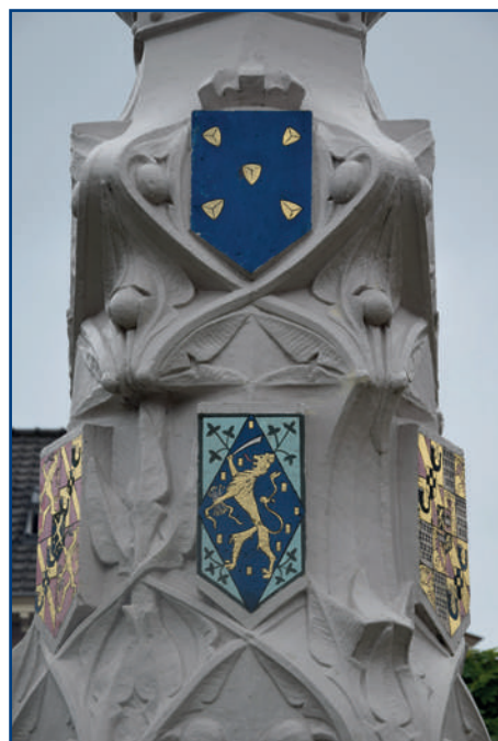
Wapen van Bussum en wapen van koningin Wilhelmina

De fontein is opgericht bij de gelegenheid van de troonsbestijging van Koningin Wilhelmina in 1898. Ze was toen 18 jaar oud. Haar vader, koning Willem III, was al in 1890 overleden, waarna haar moeder, koningin Emma, in haar naam regeerde als regentes. Wilhelmina was de laatste Oranjelid, dus de ganse natie haalde opgelucht adem toen zij in 1909 na enkele miskramen het leven schonk aan een dochter, de latere koningin Juliana. In 1948 deed zij afstand van de troon, na bijna vijftig jaar koningin te zijn geweest (het regentschap van haar moeder niet meegerekend). Zij was en is daarmee met afstand het langstzittende Nederlandse staatshoofd uit de geschiedenis.