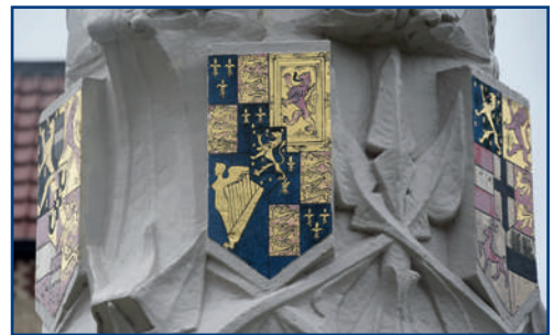
Wapen van prins Willem III

De lijfspreuk van de prins was Je maintiendrai ( Ik zal handhaven ), die hij geërfd had van zijn voorganger, René van Châlon.