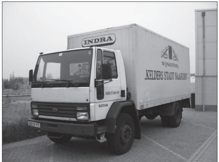
Een van de bezorgauto's van Indra

Inmiddels is het assortiment uitgebreid tot wel 40.000 artikelen. Ook kwam er in 2001 onder de naam Hocras Keuken een 'mise en place'-afdeling met bijbehorende keukens. Hier worden tot de dag van vandaag artikelen kant-en-klaar bereid voor gebruik