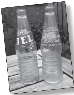
Jel frisdrank, gebotteld door Indra

nieuw verkoopconcept in Nederland. 'Vers' was vanaf het allereerste moment belangrijk. Een voor een werden de verschillende afdelingen ingericht en de bijbehorende specialisten aangetrokken. Maar de klanten wilden ook het food- en vers-assortiment aan huis ontvangen. Halverwege de jaren tachtig werd speciaal daarvoor een bezorgservice opgericht. Naast de vrachtwagens van Indra 't Gooi kwamen er daarom ook vrachtwagens met speciale koel- en vriesvoorzieningen van Hocras. Eind jaren 80 en begin jaren 90 krompen de activiteiten van Indra 't Gooi sterk, terwijl die van Hocras zich juist sterk uitbreidden, onder meer met nieuwe versafdelingen en een gekoelde expeditieruimte.