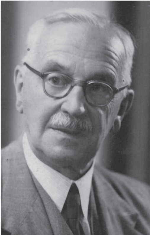
H.R. (Hugo) Kruyt