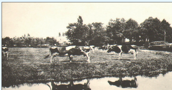
De oude haven bij de Havenstraat: weiland met sloot er omheen in 1890. Later kwam hier het Wilhelminaplantsoen

In 1906 werd de door particulieren aangelegde Brediusweg met bijbehorende brug over de Bussumervaart door de gemeente overgenomen. Bij raadsbesluit van 24 mei 1938 werd besloten tot het leggen van een dam i.p.v. de brug en het maken van een los- en laadplaats langs gedeelten van de Bussumervaart en de Nagtglassloot.