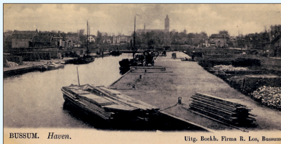
De nieuwe haven in de jaren '20. Op de achtergrond de St. Vituskerktoren. De Wilhelminakerk was er nog niet

Waar nu het gemeentehuis staat was vroeger 'de nieuwe haven'. 'De oude haven' lag zuidelijker en wel waar nu het Wilhelminaplantsoen is. De Havenstraat herinnert nog aan die situatie. Het weiland, omgrensd door de sloten deel uitmakend van die vroegere haven, heette 'Veer-kamp'. In 1897 werden de sloten gedempt en werd een begin gemaakt met de aanleg van de nieuwe haven.