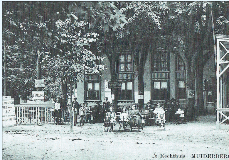
Het Rechthuis in 1920