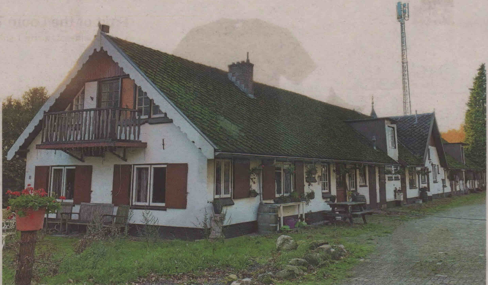
De stallen zoals ze er nu bijstaan direct achter het Hocrasterrein.

Naar het idee van de vereniging zijn de langgerekte paardenstallen uit cultuurhistorisch oogpunt belangrijk genoeg om te behouden. De bouwstijl is eenvoudig en landelijk, met chaletstijl-invloeden, maar ver-