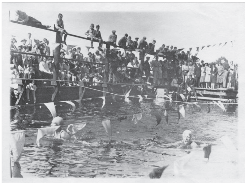
De opening van het zwembad op 31 augustus 1931.

Reparatie was niet mogelijk, of was veel te duur, terwijl het water van de Vecht al de eerste