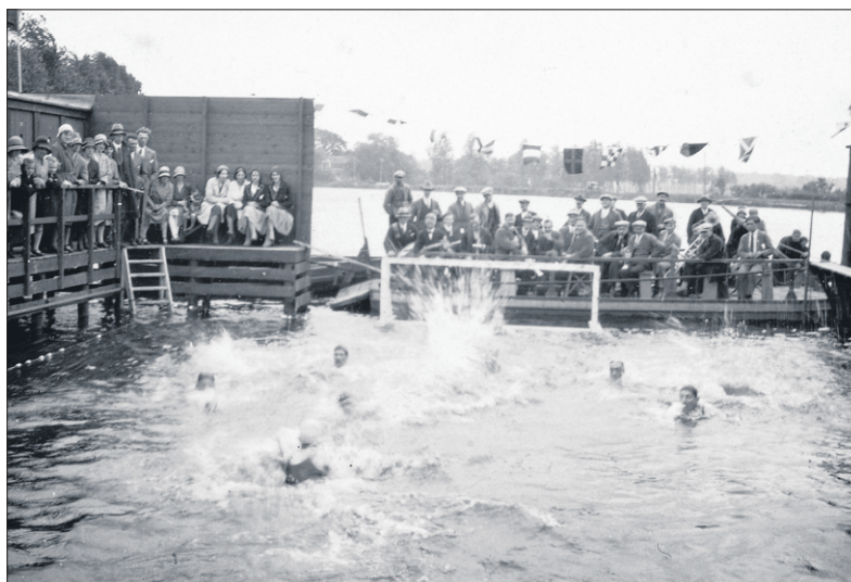
De eerste waterpolowedstrijd werd opgeluisterd door muziekvereniging Crescendo.