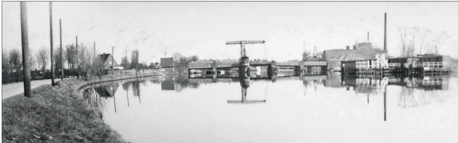
Rechts het zwembad toen het al niet meer in gebruik was.

Tot in de dertiger jaren was er weinig belangstelling voor zwemmen. Misschien lag het aan de mentaliteit van onze bevolking, met een overwegend christelijke geloofsovertuiging, of er was zó veel water in de omgeving dat er geen behoefte was aan een zwembad. De mannelijke jeugd had zichzelf wel zwemmen geleerd in de haven of in de Vecht. Meisjes kwamen nagenoeg niet aan bod, wat dat betreft.