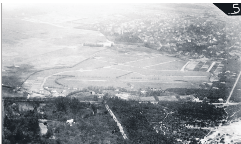
De Hilversumse Meent die per ongeluk bij Hilversum kwam.