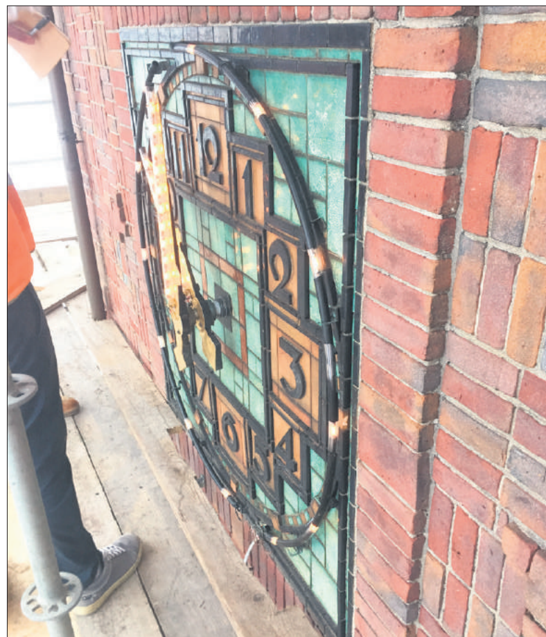
Renovatie van de stationsklok.

Daarnaast schrijven we in dit nummer ook over andere onderwerpen: de opvallende witte huizen aan de Irisstraat, de Ceintuurbaan en de Goudenregenstraat; de geschiedenis van de arbeiderswoningen aan de Naardense Huibert van Eijkenstraat die mogelijk gesloopt gaan worden, maar die 100 jaar geleden gebouwd werden om de schrijnende woningnood van die dagen te verlichten; oude en nieuwe grens-