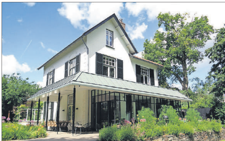
Verduurzaamd en gemoderniseerd in het Spiegel.

In de aflevering van Bussums Historisch Tijdschrift die deze week bij leden van de Historische Kring Bussum in de bus valt, komen die uitdagingen aan bod. Het gaat daarbij niet alleen om isolatie, energiebesparing en warmtepompen, maar ook om behoud van historische en culturele waarden van de natuurlijke en de bebouwde omgeving, waar we juist bij ons in het Gooi zo trots op zijn.