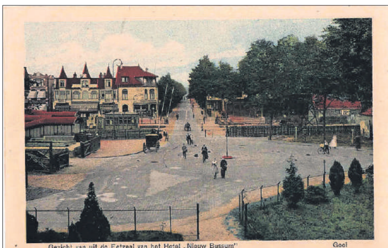
Uit de collectie Runhaar: zicht op de spoorwegovergang vanaf het balkon van Hotel Nieuw-Bussum.

COLLECTIE WINTHORST (GEMEENTEARCHIEF GOOISE MEREN EN HUIZEN)