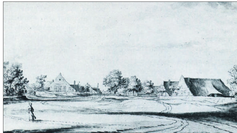
■ Tekening van Claes Jansz Visscher uit 1600. De Brink en (ver) op de achtergrond Naarden.

Geen wonder dat de leus 'Liberté, Égalité & Fraternité' (Vrijheid, Gelijkheid en Broederschap) van de