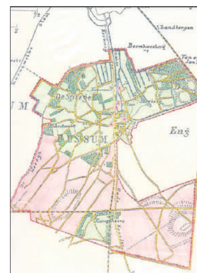
■ De grenzen van 1824 (kaart uit 1867).