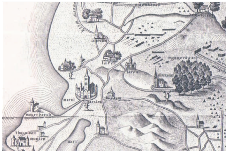
■ Kaart van Goert die Greef uit 1524. Het noorden ligt links, Bussum is al aangegeven met een kapel en curieus is dat de weg door Bussum niet naar Hilversum gaat.

Deze Bussumers konden nu bij gevaar schuilen in de vesting, maar dat was wel zo'n beetje het enige