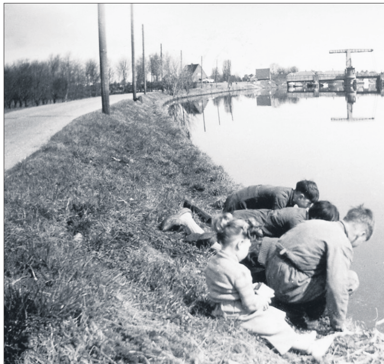
■ Vechtbrug met Weesperweg 1958.

FOTO EN TEKST: STREEKARCHIEF GOOISE MEREN