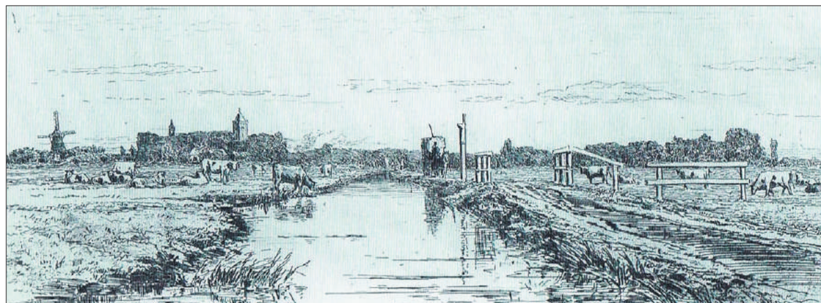
■ Weg tussen Muiden en Weesp, Carel Nicolaas Storm van 's Gravesande, ca. 1877 (coll. Rijksmuseum Amsterdam).