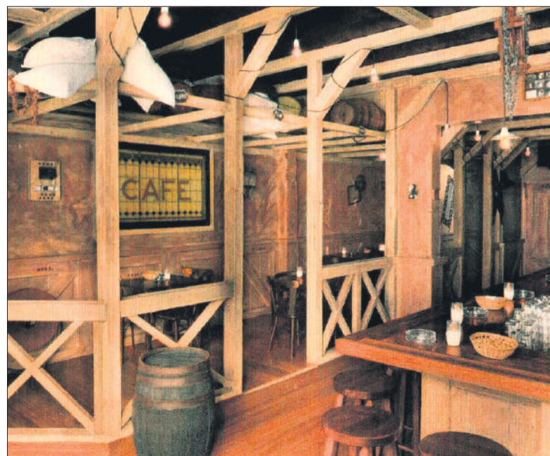
■ Interieur café Cécil in de jaren 80.