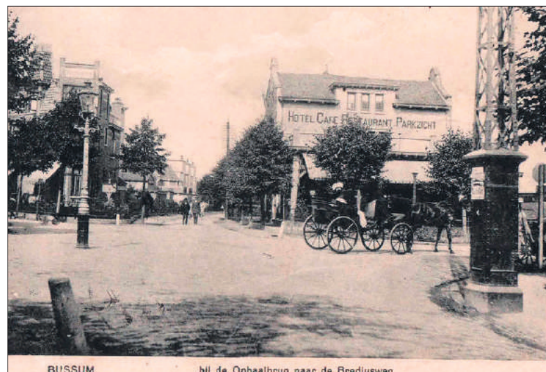
■ Hotel Parkzicht.