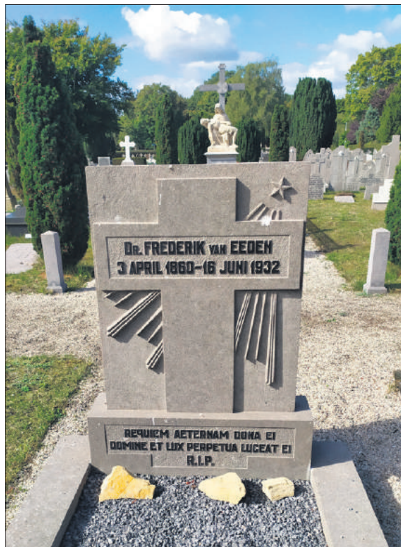
■ Het graf van Frederik van Eeden.

De begraafplaats is 30 tot 45 m breed en 190 m lang. Het ontwerp ervan is mogelijk geïnspireerd op het werk van de 17e-eeuwse Fran-