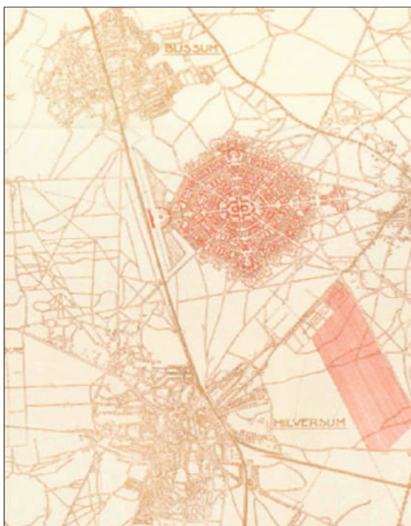
Tuinstad tussen Bussum en Hilversum.

het Gooi had een tuinstad moeten worden. De tuinstad als voorstad was op dat moment een modern en modieus concept. In het interview uit september 1922 was De Miranda zo slim om op de economische voordelen van de bouw van zo'n tuinstad te wijzen: het afzetgebied voor het midden- en kleinbedrijf van omliggende gemeenten zou flink worden uitgebreid en de werkloosheid in Huizen zou in één klap geheel ongedaan worden gemaakt. Toch waren de eerste reacties eensluidend negatief. De burgemeester van Hilversum nodigde per omgaande zijn Gooise collega's uit voor spoedberaad. Het Gooi was even eerder al opgeschrikt door ternauwernood teruggewezen plannen van de Spoorwegen om een nieuwe sneltramverbinding aan te leggen, die belangrijke natuurgebieden zou doorkruisen. Toch hadden sommigen in het Gooi wel oren naar het plan, met