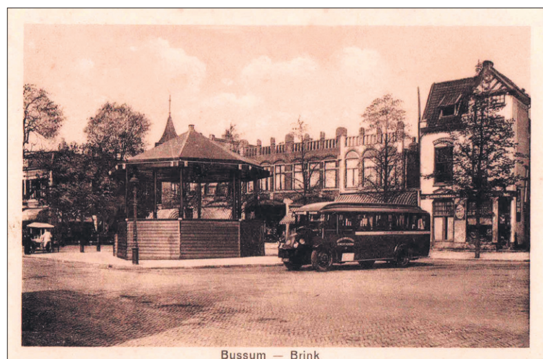
Bussum - Brink