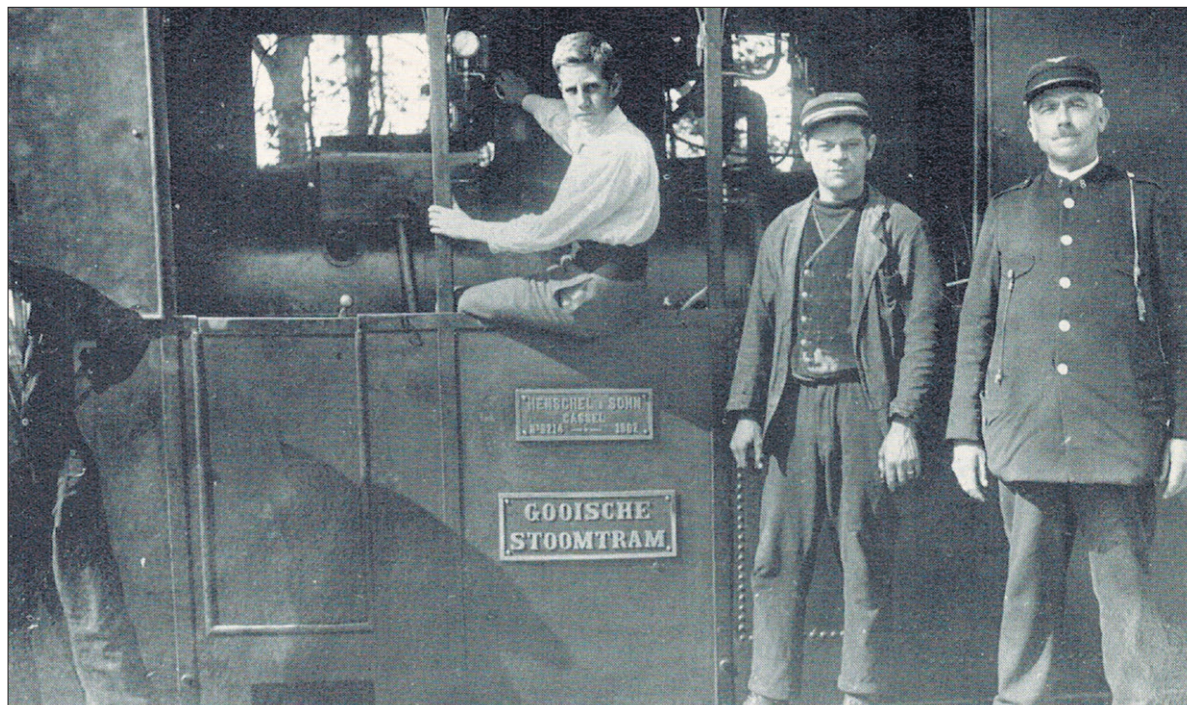
■ Een stoomlocomotief in 1924 met v.l.n.r. de stoker, de machinist en de conducteur.