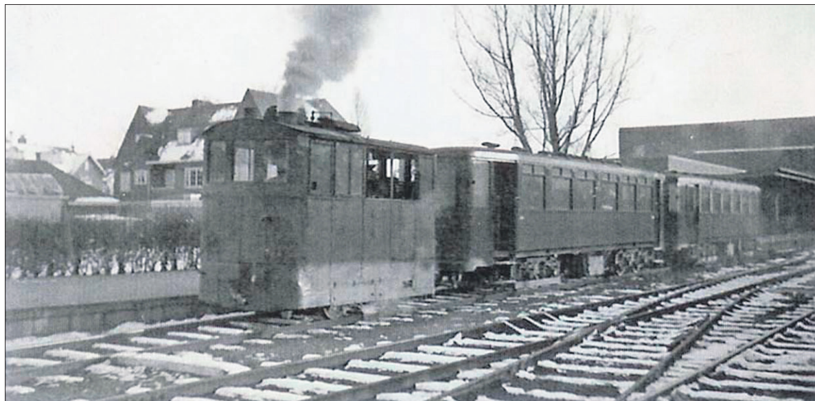
■ Een van stal gehaalde stoomlocomotief in 1940 bij station Naarden-Bussum.

FOTO EN TEKST: STREEKARCHIEF GOOISE MEREN