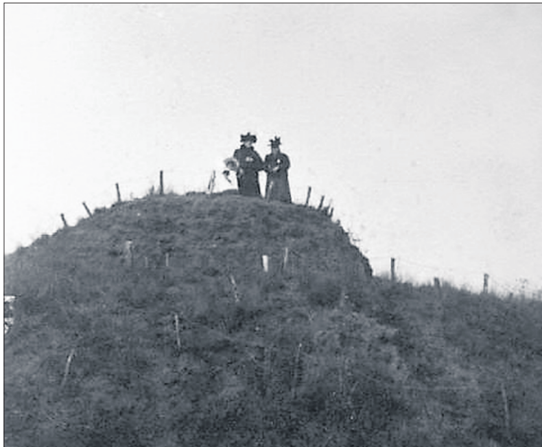
■ Twee vrouwen met kind op de Mariaheuvel 1900 (Archief Gooise Meren & Huizen).