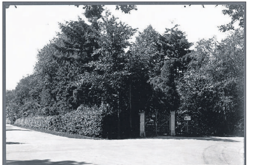
■ Het toegangshek aan de Meentweg met een bord 'Te Koop'.