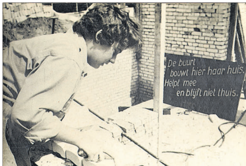
Een vrijwilliger aan het metselen.