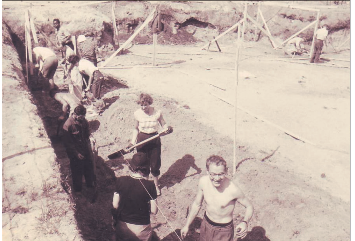
De studenten van het zomerwerkkamp graven sleuven voor de buitenmuur.

Particulieren en bedrijven kwamen met giften. Zo leverde een bedrijf gratis de radiatoren en be-