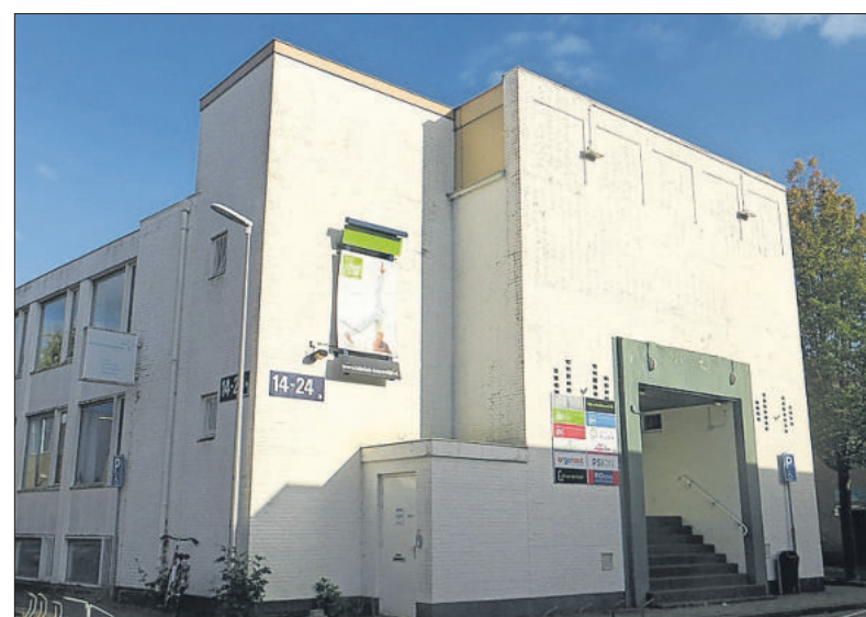
In het voormalige buurthuis zitten nu kleine bedrijven.