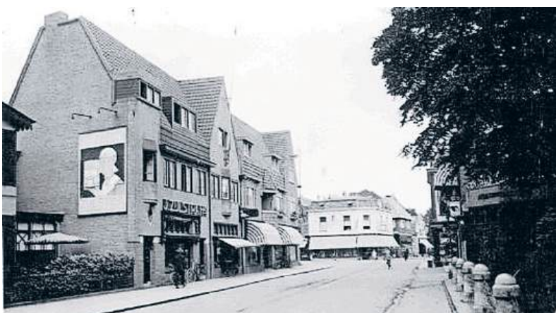
■ De tweede winkel van links in het hoge pand is Bakkerij Kannevorff aan de Brinklaan in 1928.