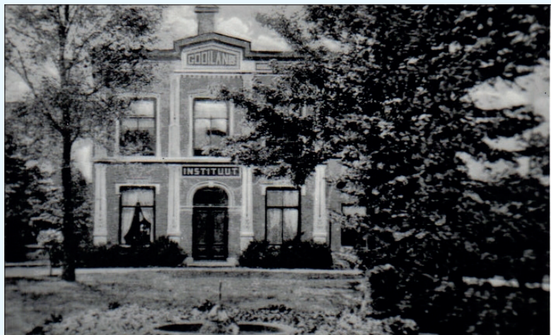
Instituut Gooiland 1898 (eerste bouw 1878)