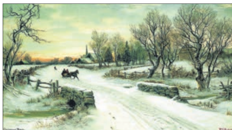
■ Christmas Morn (1885).