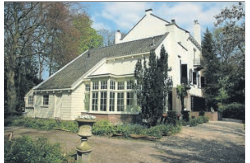
■ De villa van Breitner in Aerdenhout.